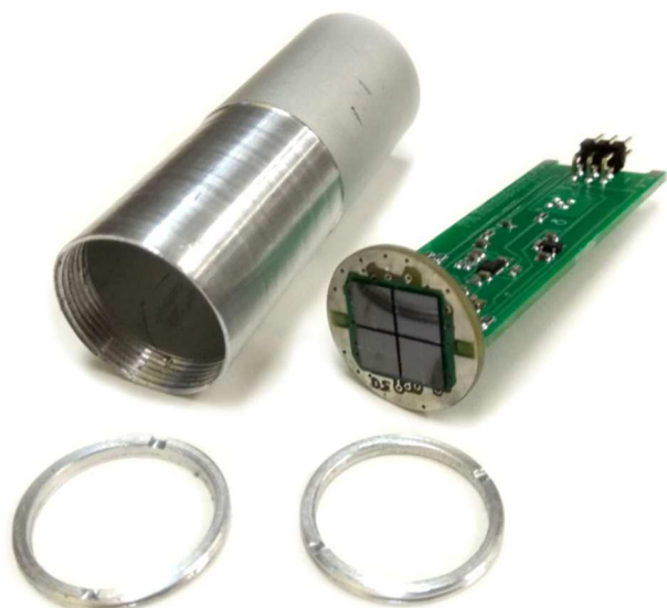
Рис. 2. Внешний вид пикселя нового детекторного кластера в разборе.