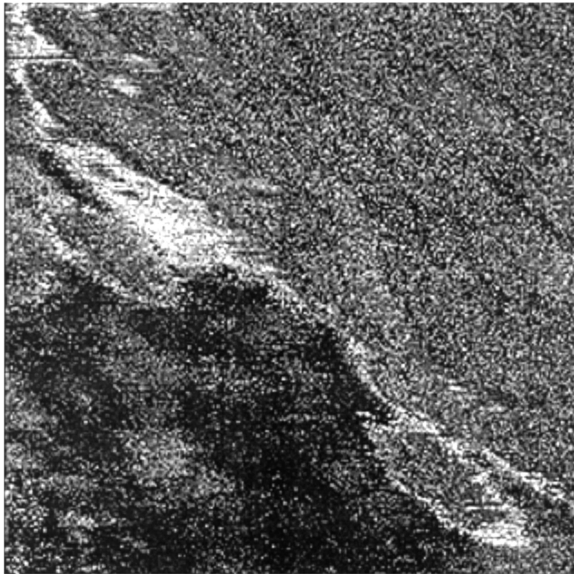
Рис. 2. Туннельная спектроскопия с модуляцией туннельного зазора участка поверхности палладий-бариевого катода 90 \times 90 nm. Участком белого цвета соответствует минимальная работа выхода (2.3 eV), серым — 3.7 eV, черным — максимальная (5.2 eV).

спиртом для удаления загрязнений и далее исследовалась на воздухе с помощью универсального комплекса сканирующей зондовой микроскопии [3], с использованием в качестве острия механически обрезанной проволоки из платиноиридиевого сплава. На рис. 1 представлено СТМ-изображение топографии микроучастка поверхности эмиттера раз-