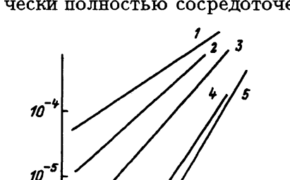
Рис. 1. Прямые ветви вольт-амперных характеристик структур \text{Cu}_{1.8}\text{S-CdSe}_x\text{Te}_{1-x} при комнатной температуре. x : 1 — 1, 2 — 0.9, 3 — 0.6, 4 — 0.7, 5 — 0.

В настоящей работе приведены результаты исследования основных свойств структур \text{Cu}_{1.8}\text{-CdSe}_x\text{Te}_{1-x} в зависимости от фазового состава твердого раствора. Поликристаллические базовые слои твердых растворов \text{CdSe}_x\text{Te}_{1-x} выращивались на металлизированных диэлектрических подложках методом вакуумной конденсации в квазизамкнутом объеме. При комнатной температуре концентрация электронов в слоях \text{CdSe}_x\text{Te}_{1-x} составляет n \approx 10^{15} \text{ см}^{-3} , концентрация дырок в \text{Cu}_{1.8}\text{S} - p = 5 \cdot 10^{21} \text{ см}^{-3} . Толщина пленки сульфида меди равнялась (40 \pm 5) нм. Указанные гетеропереходы могут быть отнесены к поверхностно-барьерным структурам, у которых вместо металла используется сильно вырожденный полупроводник — стабильная модификация сульфида меди \text{Cu}_{1.8}\text{S} [6,7]. Так же как и у контакта металл-полупроводник из-за резкой асимметрии проводимостей составляющих гетероперехода, область пространственного заряда практически полностью сосредоточена в твердом растворе \text{CdSe}_x\text{Te}_{1-x} .