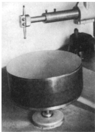
Рис. 2. Фотография зеркала диаметром 500 мм на полировально-доводочном станке.

углерод упрочняет нити каркаса и соединяет их в жесткую объемную решетку.